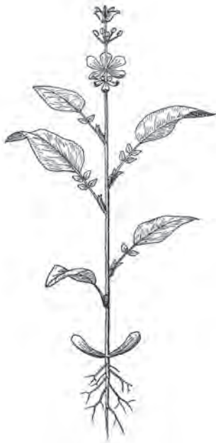
Figura 1. La planta anual, el modelo básico de Goethe en su investigación sobre la metamorfosis. Partes de la planta, separadas a propósito para la ilustración, de arriba abajo: pistilo, estambre, corola, cáliz, hojas del pecíolo, cotiledones y raíces.

cede uno o varios pasos. Allí, con un impulso irresistible y empleando todas sus fuerzas, da forma a las flores y las arma para las obras del amor; 1 aquí, en cierto modo, se debilita y, vacilante, deja a su criatura en un estado indefinido, delicado, a menudo agradable a nuestros ojos pero internamente débil e inoperante. Las observaciones de esta metamorfosis nos permitirán descubrir aquello que la regular oculta, ver con claridad lo que allí sólo podemos inferir, por lo que es de esperar que alcancemos nuestro propósito con la mayor seguridad.