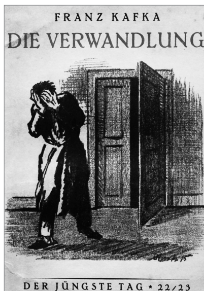
Cubierta de La metamorfosis , publicado en Der Jüngste Tag.

terminado. Y, tres semanas después, el poeta se quitaba la vida. Se envenenó.